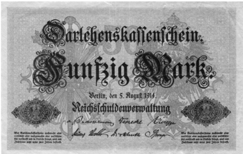
Abb. 2: Darlehenskassenschein zu 50 Mark

von einer anderen staatlichen Institution ebendiese 1.000 Mark wieder erhalten – formal zwar nicht als Banknoten, sondern als Darlehenskassenscheine. Da diese aber gleichberechtigt neben den Banknoten galten, war das egal. Auf diese Weise waren aus 1.000 Mark plötzlich 2.000 Mark geworden – die Geldmenge hatte sich wie von Zauberhand verdoppelt.