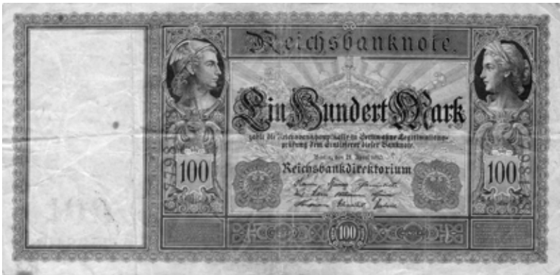
Abb. 1: Banknote zu 100 Mark

Das war eine außerordentlich kluge Konstruktion. Denn rein goldgedeckte Währungen haben einen entscheidenden Nachteil: Sie können Deflation verursachen. Wenn die Wirtschaft rasant wächst – wie es am Ende des 19. Jahrhunderts der Fall war –, dann steigt auch der Bargeld- und Kreditbedarf von Unternehmen und Privathaushalten schnell. Wenn die Banken dann jedoch kein zusätzliches Gold in ihre Tresore füllen können, dürfen sie auch kein zusätzliches Geld ausgeben. Sie können der wachsenden Wirtschaft nicht die notwendigen finanziellen Mittel bereitstellen. Dann gibt es zwar immer mehr Waren, die Geldmenge bleibt jedoch konstant. Die Folge: Der Preis der Waren sinkt, es kommt zu einer Deflation. Das wiederum führt dazu, dass sich Firmen und Privatpersonen beim Einkauf zurückhalten. Schließlich könnte die Ware ja in Kürze noch günstiger zu haben sein. Die Nachfrage geht zurück, als Folge davon bricht die Produktion ein, und die Wirtschaft gerät in einen Abwärtsstrudel. Genau das passierte im 19. Jahrhundert in verschiedenen Ländern immer wieder.